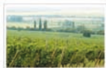
Max III (Certificación Orgánica)